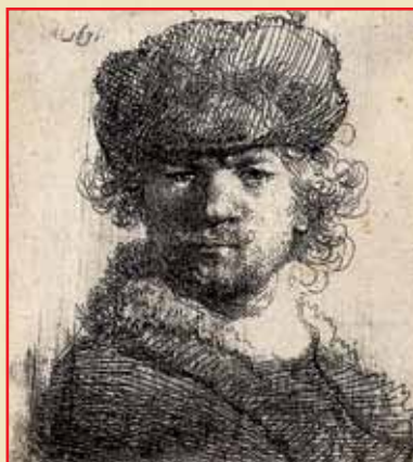
Рембрант - Автопортрет Rembrandt - Self Portrait